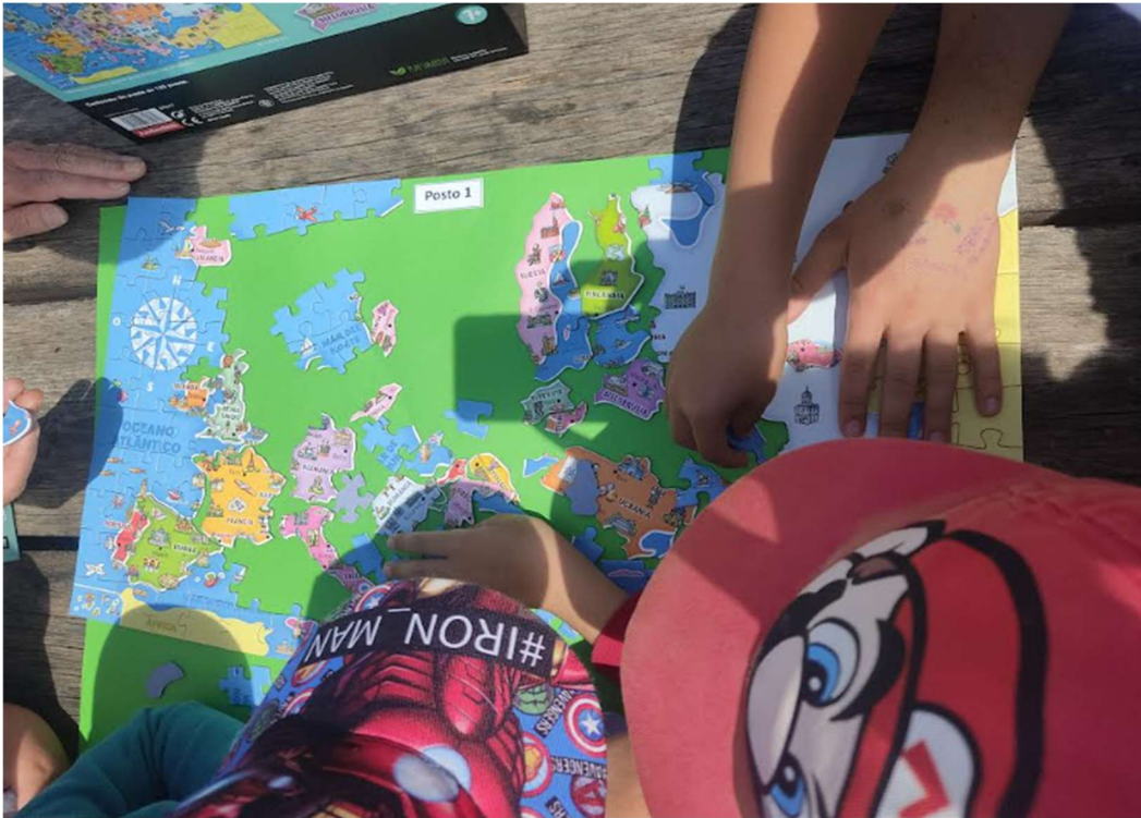
Foto 1- Puzzle da Europa