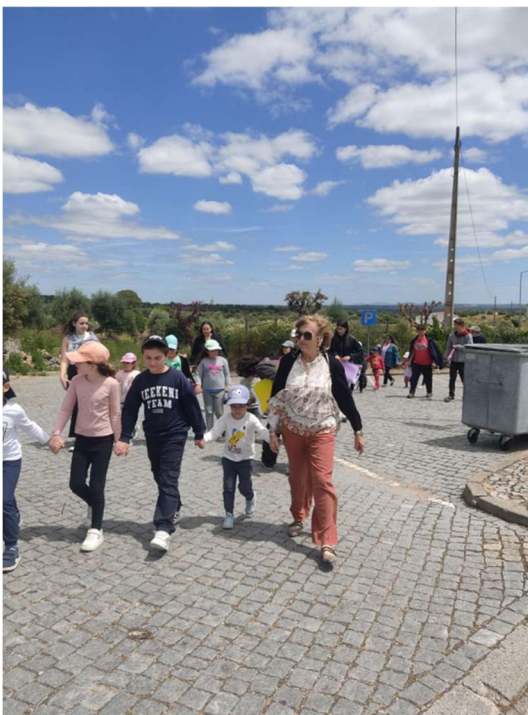
Foto 2- Meninos do Pré escolar e 1º ciclo