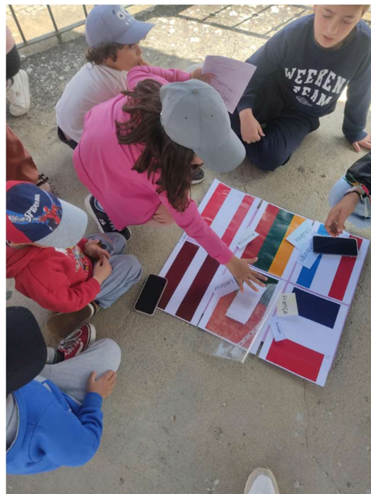
Foto 3- Bandeiras de países da Europa